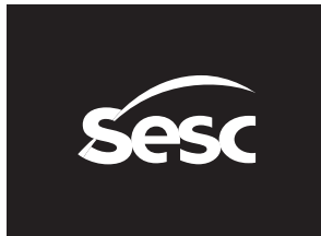
versão monocromática negativa