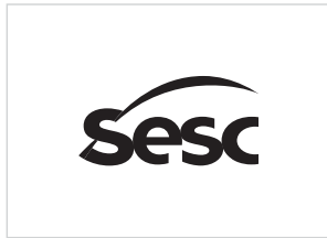
versão monocromática positiva

A marca monocromática deve ser aplicada exclusivamente nas cores preto (versão positiva) ou branco (versão negativa) ou azul Sesc (sobre fundo branco) , pois qualquer outra cor pode comprometer a caracterização da identidade visual.