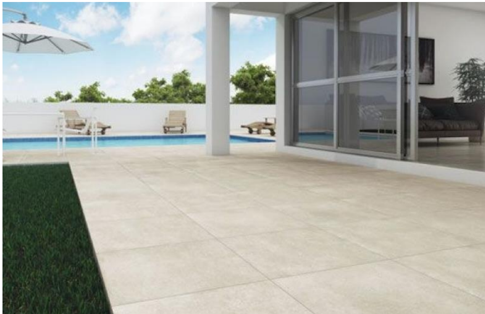
Figura 03: Exemplo de piso tipo porcelanato aplicado em área externa