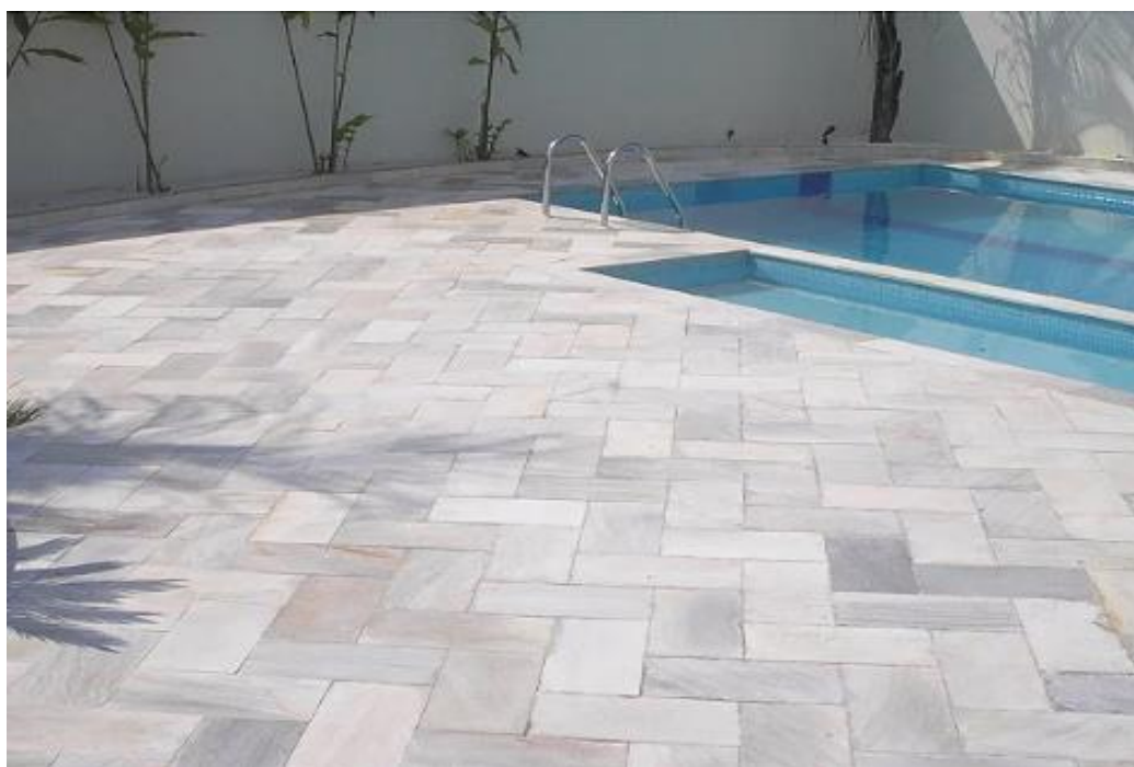
Figura 01: Exemplo de piso de pedra natural em área externa