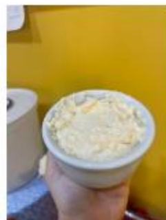
FOTO 03 – Teste do produto