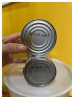
FOTO 02 – Embalagem fechada