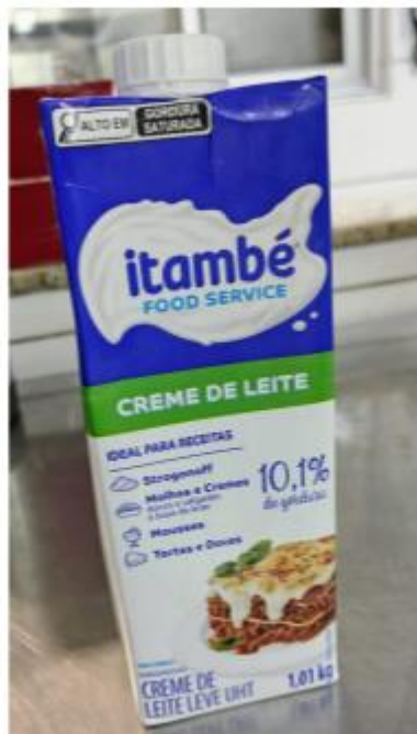
FOTO 01 - Produto na embalagem